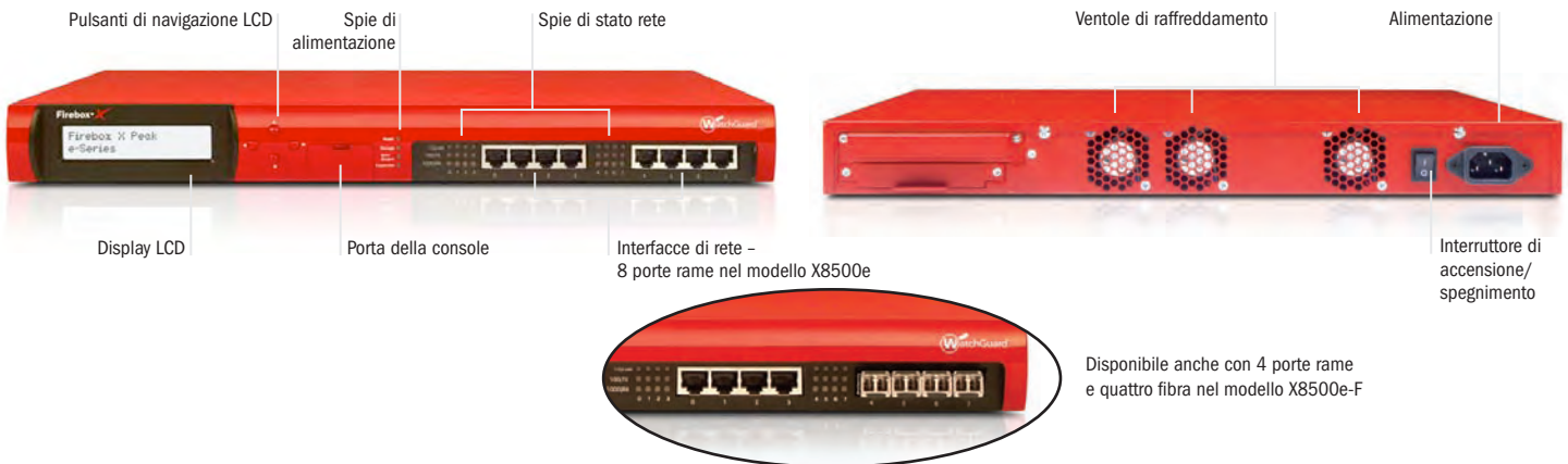
Disponibile anche con 4 porte rame e quattro fibra nel modello X8500e-F