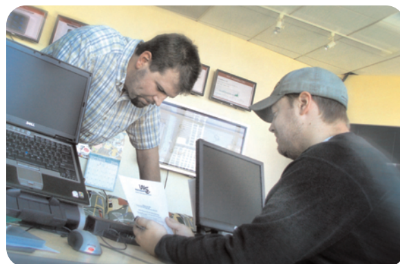
Il team LiveSecurity assicura un tempo di risposta di 4 ore